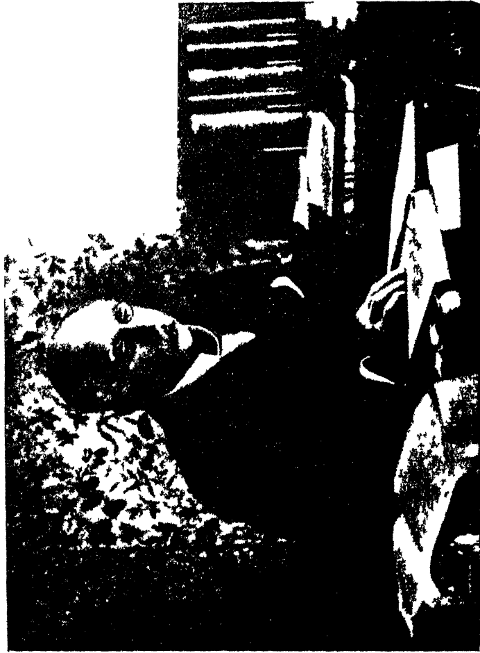
आर० टी० एच्० त्रिफिथ, प्रिसिपल, गवर्नमेण्ट सस्कूल कालेज, बनारस, १८६१-१८८८